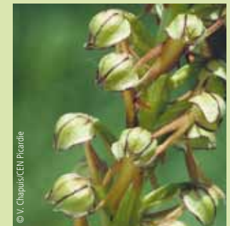
L'Orchis homme-pendu : Orchidée très rare en Picardie, elle doit son nom à la forme de ses délicates petites fleurs vert-jaune et forme des tapis de plusieurs centaines de pieds au cœur du larris, dès le mois de mai.

Les visites guidées par le Conservatoire d'espaces naturels de Picardie vous permettront d'apprécier la diversité de la faune et de la flore. Au printemps, l'Hippocrélide en ombelle et le thym serpolet composent des tapis jaunes et violets, parsemés d'orchidées, comme, par exemple, la rarissime Orchis « Homme pendu ». L'été, fleurissent les églantiers ou la Digitale jaune. Papillons, criquets et sauterelles sont les hôtes des lieux et vous accompagneront.