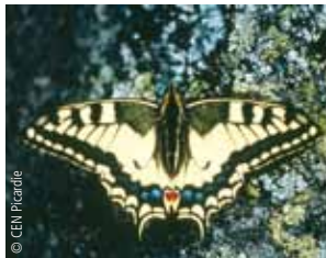
Le Machaon : c'est l'un des plus grands papillons diurnes de France. La présence sur le coteau de cette espèce en forte régression illustre l'intérêt des espaces « refuges » tels que les larris.

Pour découvrir le site, rendez-vous au belvédère de Vaux, le point de vue sur la vallée y est superbe. Des îlots en cours de restauration sont tapissés de roselières au pied du larris.